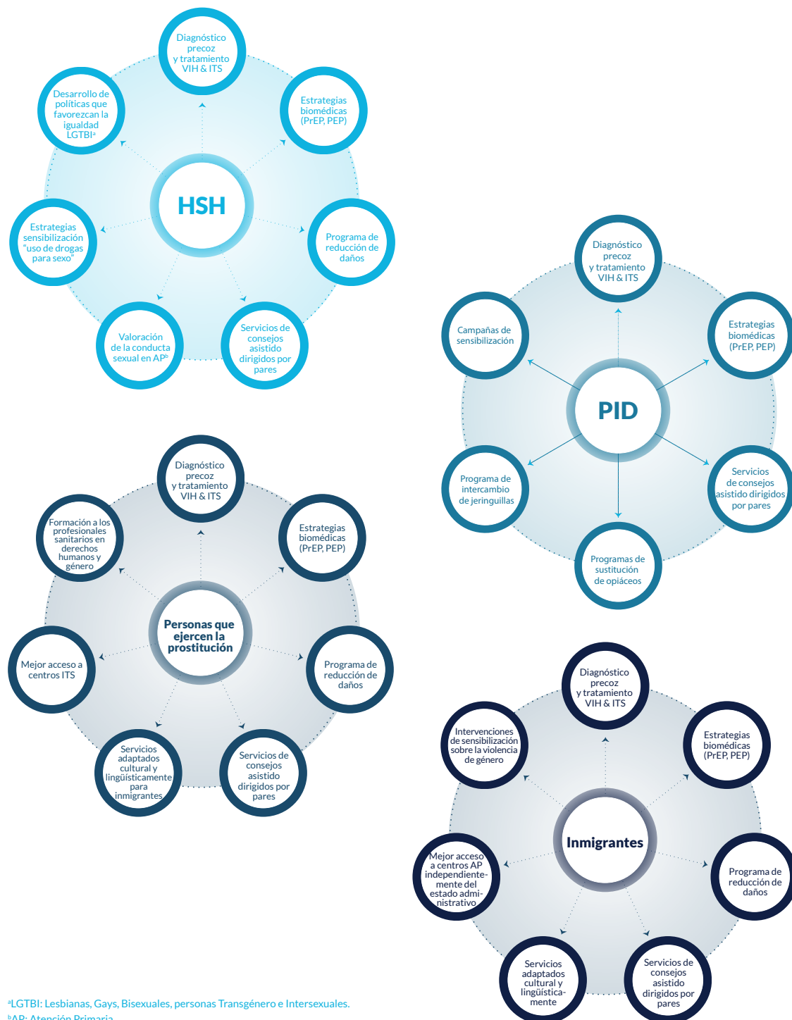
Figura 6: Ejemplos de prevención combinada en grupos poblacionales clave

En conclusión, para esta primera fase del continuo de atención el grupo multidisciplinar sugiere insistir en que las estrategias de prevención del VIH deben combinar acciones sobre el cambio de conductas, biomédicas, de tratamiento y estructurales. Estas estrategias se deberán implementar para todos y cada uno de los grupos poblacionales existentes en cada entorno local, sin olvidar a la población general o a las personas heterosexuales que también tienen riesgo de infección. A modo de ejemplo, a continuación se presentan algunos paquetes de prevención combinada que se podrían implementar en cuatro grupos poblacionales (Figura 6).