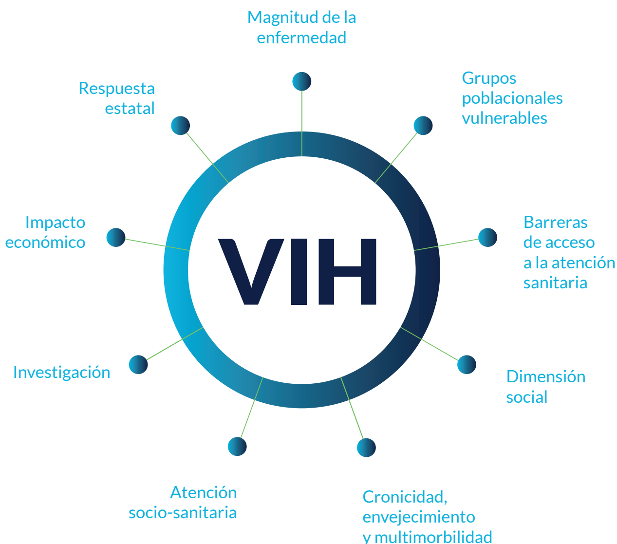
Figura 1: Análisis Global de la infección por VIH en España

El resultado del análisis de las nueve dimensiones en su conjunto proporciona una visión global de la infección por VIH que, debido a su actual naturaleza crónica, presenta unas particularidades no conocidas hasta la fecha que requieren una reflexión sobre cómo enfrentarse al manejo de la nueva situación de la infección.