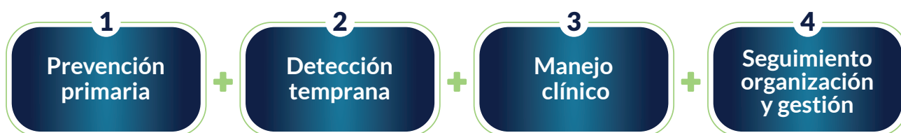
Figura 2: Marco para la identificación y clasificación de intervenciones: Continuo de atención de la infección por VIH

Partiendo de dicho diagnóstico, la segunda parte del proyecto en la que ha trabajado el grupo es la identificación de posibles intervenciones en cada una de las fases del continuo de atención de la infección por VIH (Figura 2).