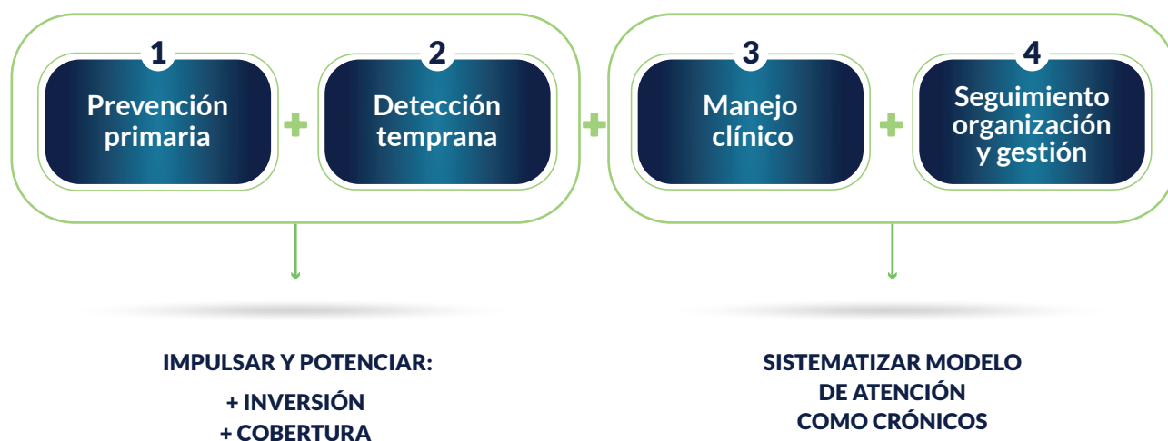
Figura 3: Marco para la identificación y clasificación de intervenciones: Continuo de atención de la infección por VIH

Por otra parte, respecto a las fases 3 y 4, se sugiere la sistematización del modelo de atención de la infección por VIH, tomando como base los principales componentes que mejoran la gestión de enfermedades crónicas. En este caso, las intervenciones propuestas no suponen una inversión importante de recursos, sino que más bien consiste en definir un modelo de funcionamiento homogéneo para todas las unidades de VIH, potenciando algunos componentes que permitirán ofrecer una atención de mayor calidad y más adaptada a las necesidades de enfermos crónicos (Figura 3).