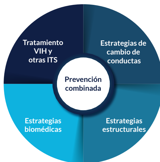
Figura 5: Prevención combinada de alta eficacia