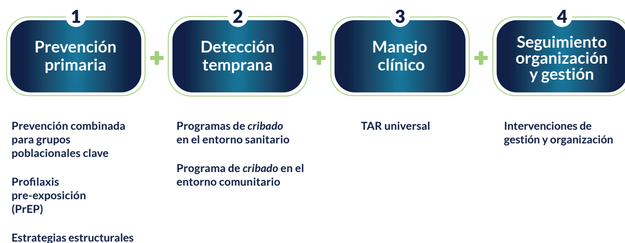
Figura 4: Propuesta de intervenciones para España

A continuación se muestra el resultado de este ejercicio de estructuración de las intervenciones más indicadas para la actual situación de España (Figura 4).